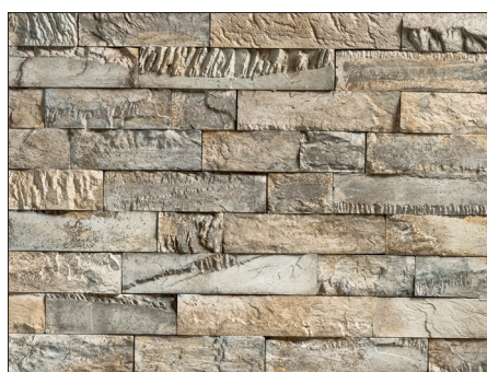
BC 34 CREATIVO SM / BC SMALL / MUSCHELWEISS