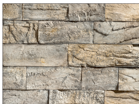
BC 34 CREATIVO LA / BC LARGE / MUSCHELWEISS