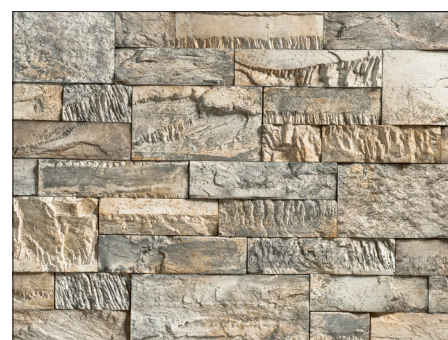
BC 34 CREATIVO LA + SM / BC LARGE 50% + SMALL 50% / MUSCHELWEISS