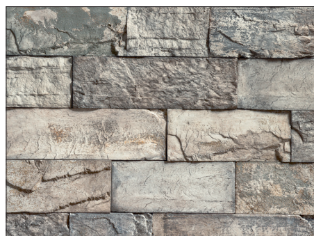
GF 34 CREATIVO LA / GF LARGE / FOSSILGRAU