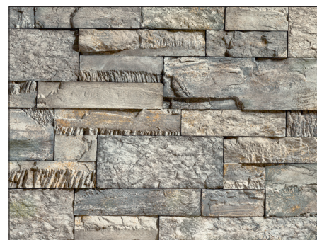
GF 34 CREATIVO LA + SM / GF LARGE 50% + SMALL 50% / FOSSILGRAU

In oberen Bildern wurden die 2 Größen des selben Farbtons gemischt EMPFOHLENER MIX: 50% LARGE + 50% SMALL. Wegen der Sonderverpackung ist diese Vermischung nur auf der Baustelle möglich.