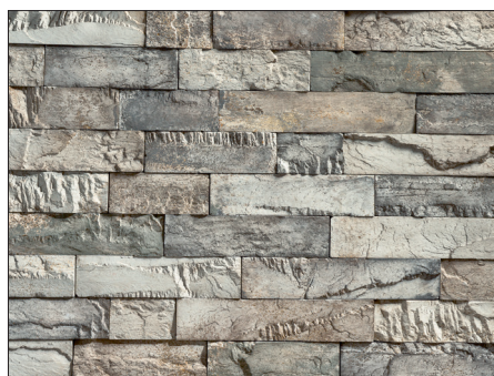
GF 34 CREATIVO SM / GF SMALL / FOSSILGRAU